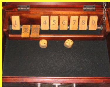
Shut The Box